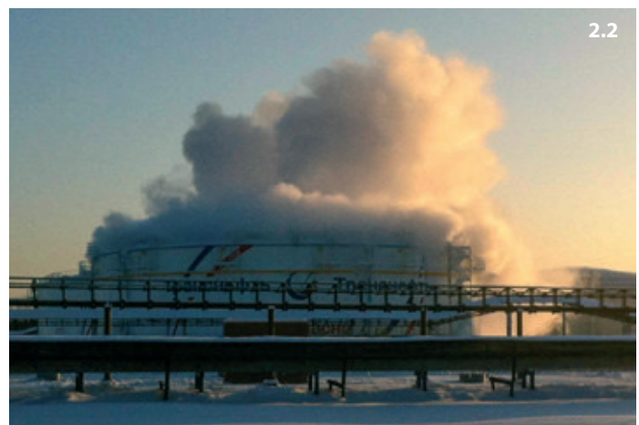
Рис. 2. 1. Устройство для выпуска CO 2 . 2. Выпуск CO 2 на РВС-20000.

с вместимостью сосуда от 3 до 28 м 3 , предохранительной и переключающей арматуры, средств измерения, весового терминала, запорно-пускового устройства, обеспечивающего хранение и выпуск CO 2 , распределительных устройств для подачи двуокиси углерода в требуемом направлении, холодильных агрегатов и электронагревателей для поддержания рабочего давления в изотермическом сосуде при различных температурах окружающей среды, насадков для подачи диоксида углерода внутрь резервуара, а также шкафа управления МИЖУ (рис. 1).