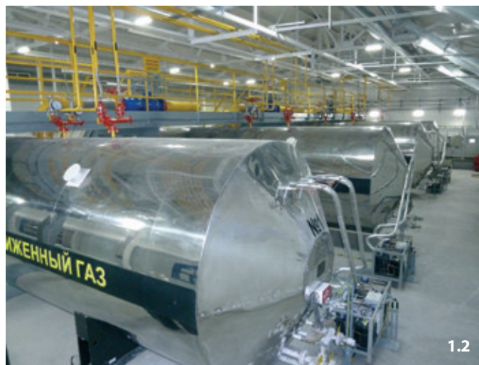
Рис. 1. 1. Здание станции газового пожаротушения. 2. Установка газового пожаротушения на базе 4-х МИЖУ.